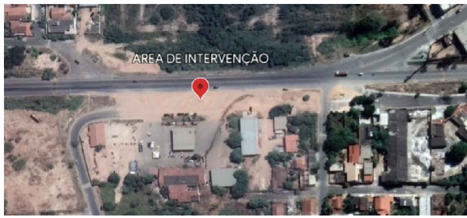
PLANTA DE LOCALIZAÇÃO SEM ESCALA